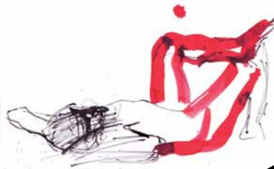
ILUSTRACJA: JOANNA BIEŃKOWSKA