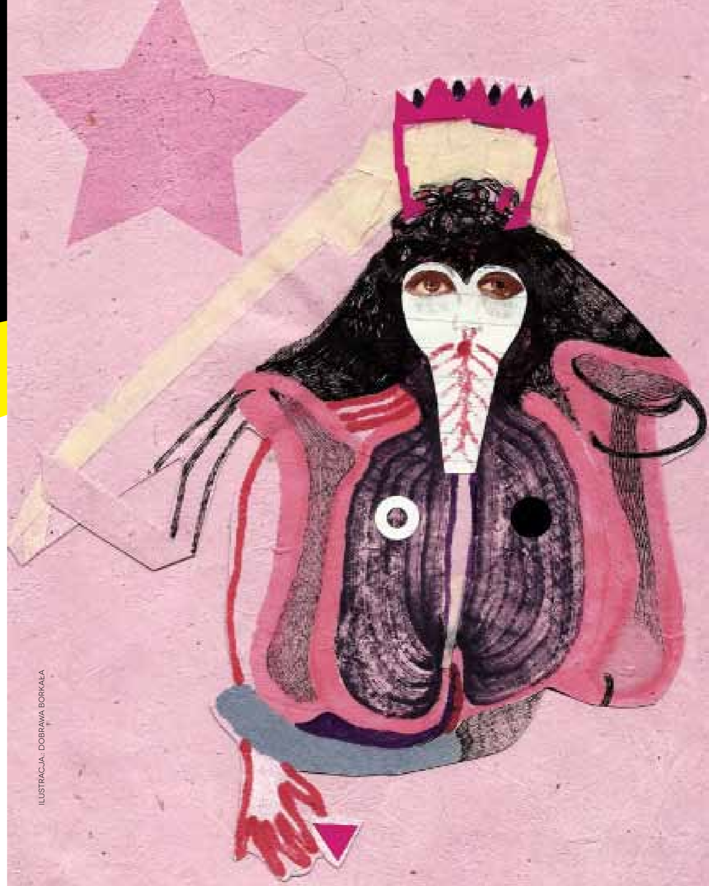
ILUSTRACJA: DOBRAWA BORKAŁA

Spakowana walizka, zatankowany samochód, paszport w garści i ogromny pośpiech w drodze na Okęcie. Znowu tylko pół godziny do odlotu, a ja grzęznę w korkach. Jeszcze brie-